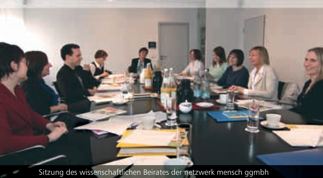
Sitzung des wissenschaftlichen Beirates der netzwerk mensch ggmbh