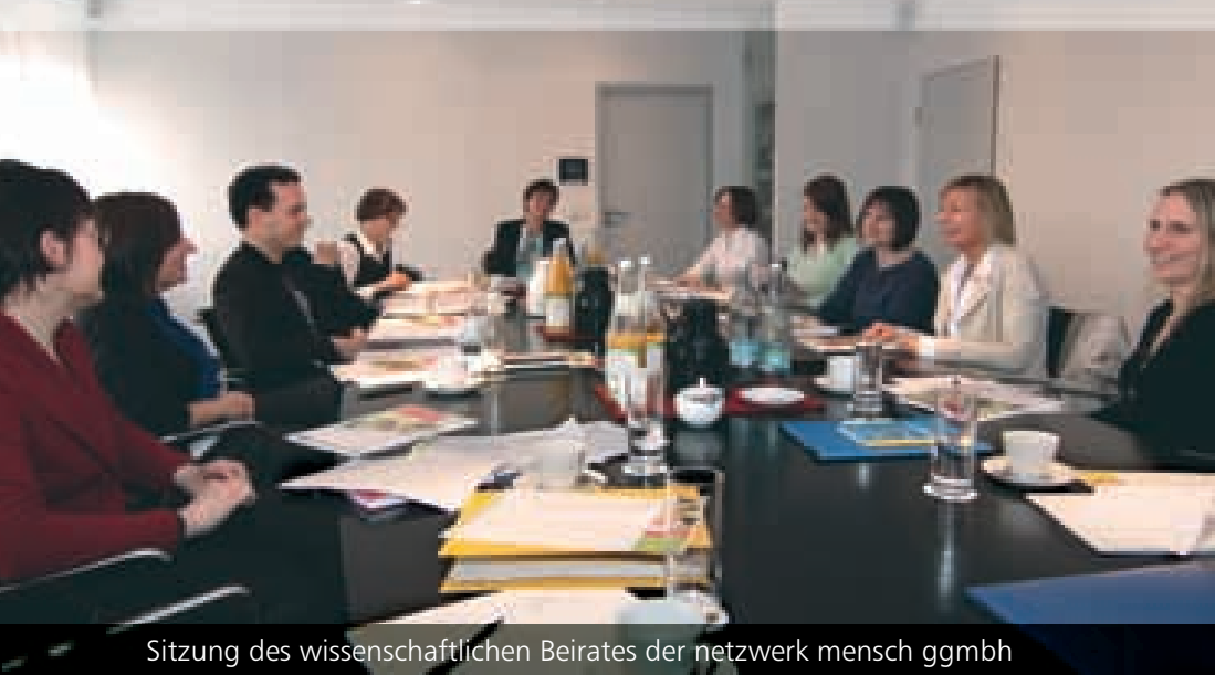
Sitzung des wissenschaftlichen Beirates der netzwerk mensch ggmbh